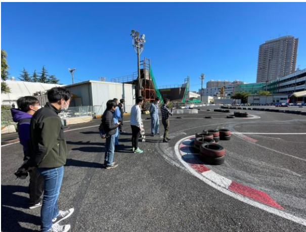
Fig.2 コース周回しながらの講習

走行前、コースを周回し、どのようにカーブを曲がるか、また前日の雨で路面が濡れていたため、スピードの制御方法など講師に指導して頂いた。