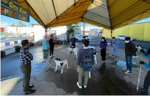
Fig.1 距離を保ちながらの開会式