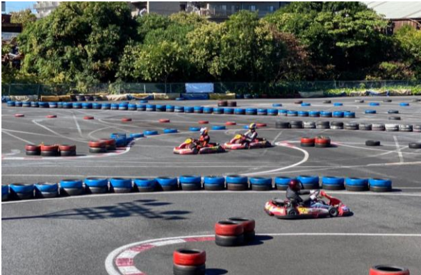
Fig.9 耐久レース時の様子

途中から、腕と体力的にきつくなり、スピンの増加、上手くカーブが曲がれなくなった。